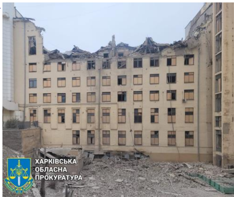
ХАРКІВСЬКА ОБЛАСНА ПРОКУРАТУРА