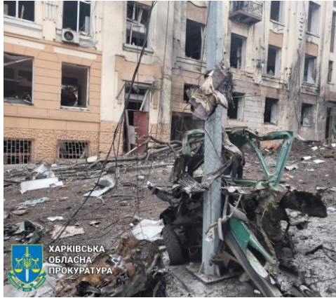
ХАРКІВСЬКА ОБЛАСНА ПРОКУРАТУРА